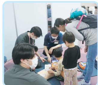
BLS (一次救命処置) 体験