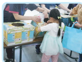
お菓子つかみ取り