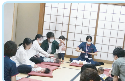
ベビーマッサージ教室