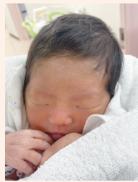
6月1日産まれ 女の子