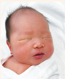
5月30日産まれ 女の子