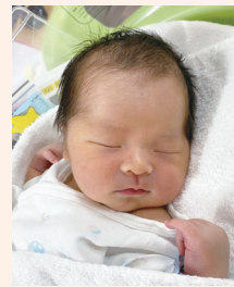
6月15日産まれ 男の子

初産で分からないことだらけでしたが、お産も安産で穏やかだったと誉めて頂き、入院中も色々教えて下さりスタッフの方々には本当に感謝しております。これからの生活がとても楽しみです♪