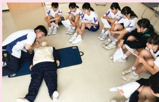
↑ 地域の小中学生への心肺蘇生法講習会

転院搬送やプレホスピタル搬送で使用する救急車両も、毎朝安全点検を行っています。午前中は一般外来担当とER担当に分かれ、それぞれの業務を行います。一般外来では外科や整形外科を担当し、医師の診療補助も行います。ER担当では救急ホットラインを担当、救急隊から必要な情報を聴取し受入判断を行っています。午後からは、救急ホットラインと救急患者対応を中心に