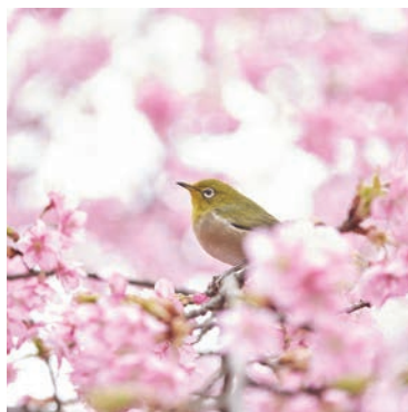
cover photo MEMO