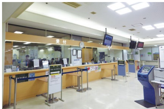
新装となった受付カウンター、 コロナ禍のなか、感染対策には万全の対応を心がけております。

今年3月から小児科全般の医師として常勤になりました。産婦人科のある小児科医として安全なお産をサポートしつつ、保護者の方の子育ての力になりたいです。この夏、神戸徳洲会では、入院可能な小児病棟も再開します。