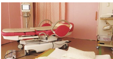
フリースタイルのお産が可能な分娩室