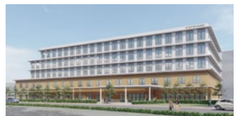
2025年完成予定の新病院イメージ図

2025年には2棟目の病棟（垂水体育館跡地）が完成予定。徳洲会の理念「断らない救急」の高いレベルの実現を目指して参ります。