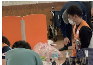
センター内では主に福祉エリアを担当しました。被災者の方の体調ケアをしつつ、現場の感染制御に努めました。