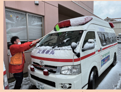
低気温で、現地の屋外では積雪がありました。