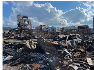
地震で崩壊された支援先付近の光景。