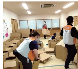
搬入された段ボールベッドの組み立て作業。