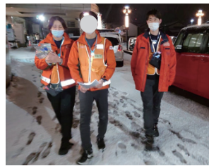
夜間は、車中泊をされている方のエコノミークラス症候群や積雪による一酸化炭素中毒の発生を防ぐため、ラウンドを行いました。