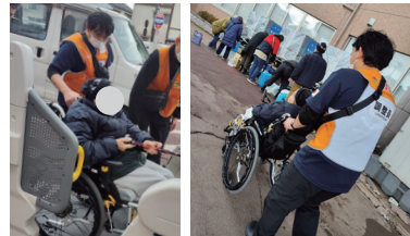
福祉施設へ移動の介助。