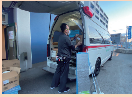
移動前に支援物品を当院の救急車に積み込みました。