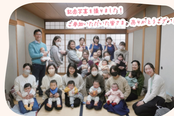
記念写真を撮りました！ ご参加いただいた皆さま、ありがとうございます！