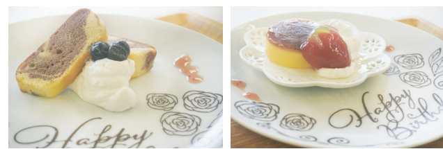
デザートは当院の栄養科が監修！2種類からお選びいただけます。

2024年12月2日(月)、6階西病棟で入院患者さんのお誕生日会を開きました！事前にお申込みいただいた療養病棟の患者さん限定で、栄養科特製バースデーデザートを今回初めて提供いたしました。当日はご家族の方もご参加くださり、病棟スタッフとともにお誕生日をお祝いさせていただきました！お誕生日おめでとうございます★