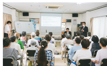
▶ 医療講演参加者の方へ説明会