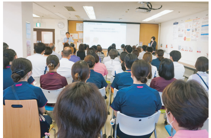
▶ 外部講師をお招きした勉強会 (参加が難しい職員には後日 E-ラーニングにて録画を配信)