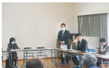
▶ 役員の方へ説明会

お申込みいただいた方は、どなたでもご参加いただける垂水区文化センターの会場での説明会の他、垂水区内の神戸市立地域福祉センターや自治会館等でも役員の方や当院の医療講演の参加者さまをご対象に実施中です。