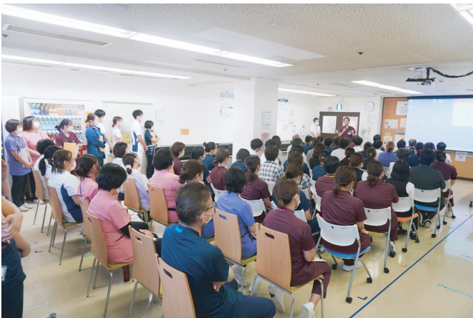
▶ 病院幹部らから職員に説明会