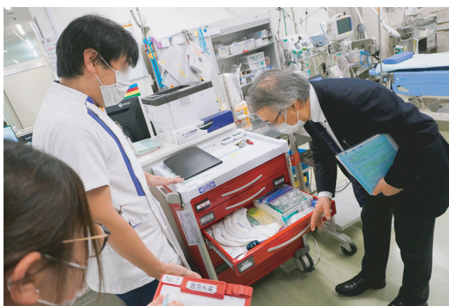
▶ 模擬審査(院内各箇所ラウンド)